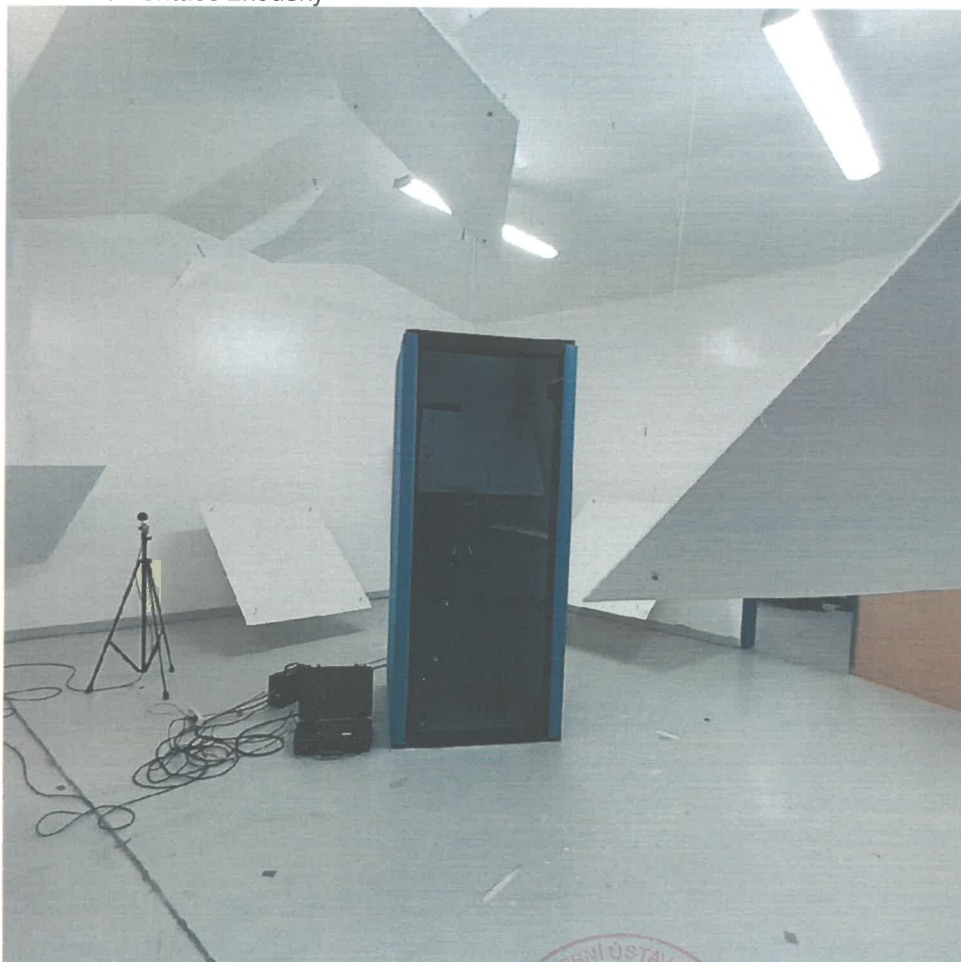
obr. č. 1 vzorek instalovaný v dozvukové komoře